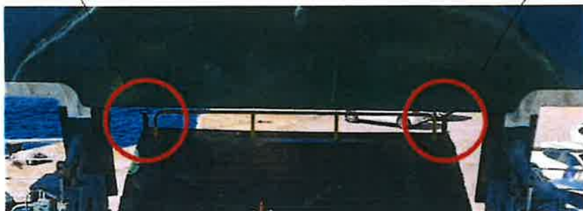
Slika 4. Prikaz vidljivosti poluga (klinova) za mehaničko osiguranje rampe sa zapovjednog mosta (kormilarnice)

Poluga za mehaničko učvršćenje (osiguranje) rampe - desna strana