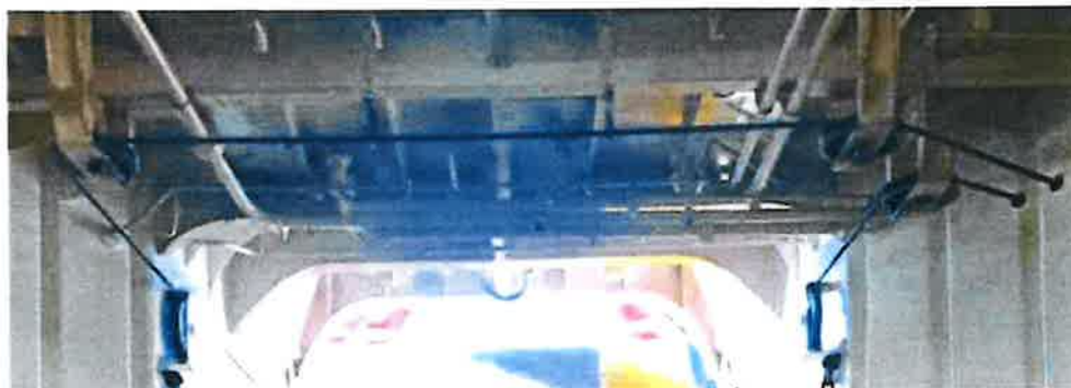
Slika 8. Sustav čelične užadi i koloturnika za podizanje/spuštanje pramčane rampe

Uključivanjem sustava rampe se, preko sustava koloturnika i sajli pomiče prema donjem ili gornjem položaju.