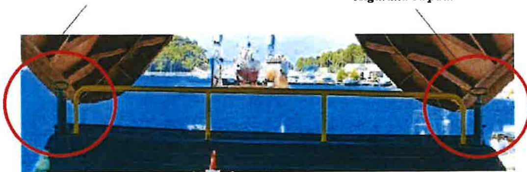
Slika 13. Prikaz položaja poluga (klinova) za osiguranje rampe u donjem položaju

Prikaz položaja poluge za mehaničko osiguranje rampe - desna strana - rampa osigurana od pada