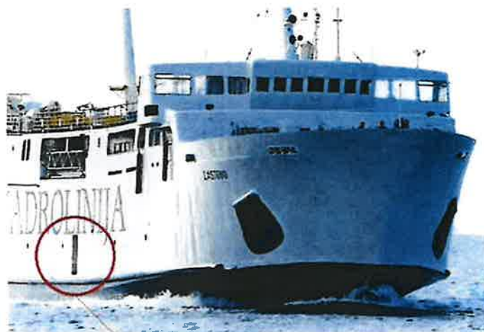
Bočna vrata za izlazak na obalu