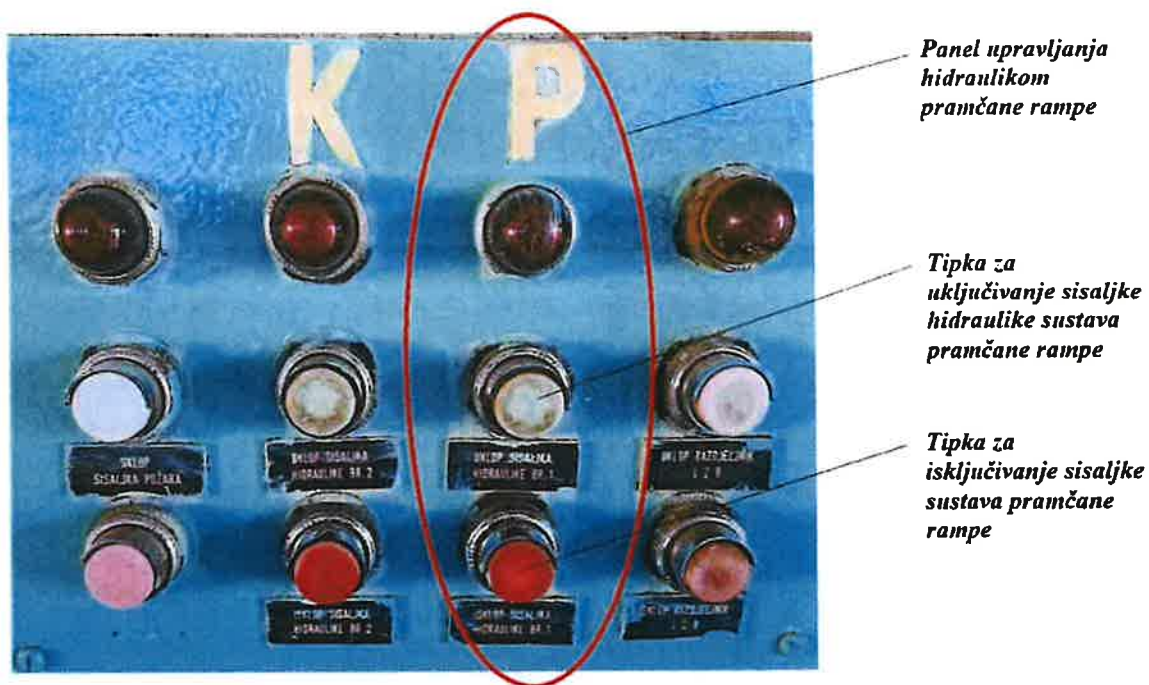
Slika 5. Prikaz panela upravljanja hidraulikom pramčane rampe na zapovjednom mostu (kormilarnici)

palubi vozila (garaži), međutim neuspješno (vidi Prilog 11 ). Kako hidraulična sisaljka rampe stvara buku, i misleći da ga vođa palube [REDACTED] zbog te buke ne čuje, zapovjednik broda [REDACTED] isključuje sisaljku hidrauličnog sustava pramčane rampe (vidi Sliku 5 ) sa zapovjednog mosta (kormilarnice) (vidi Prilog 11 i Prilog 17 ) 17 , te nakon toga ponovno bezuspješno pokušava pozvati vođu palube [REDACTED] (vidi Prilog 11 i Prilog 17 ).