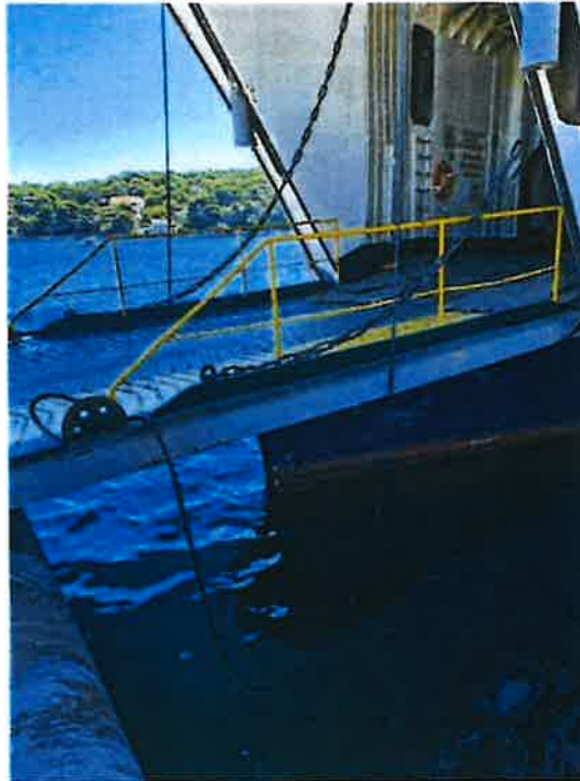
Slika 1. Prikaz položaja pramčane rampe u donjem položaju

Dana 11. kolovoza 2024. godine, obavljajući plovidbu na državnoj trajektnoj liniji br. 401 „Zadar/Gaženica – Ist/Kosirača – Olib – Silba – Premuda/Krijal – Mali Lošinj“ (vidi Prilog 3 ) u 14:55 sati brod Lastovo pristao je u trajektnu luku Mali Lošinj, Ulica Lošinjskih brodograditelja 33, 51550 Mali Lošinj (vidi Prilog 16 i Prilog 17 ), a što, vezano uz plovidbeni red na liniji (vidi Prilog 3 ) predstavlja raniji dolazak u vremenu od 15 minuta od predviđenog vremena dolaska. Nakon dolaska broda, a u svrhu iskrcaja putnika i vozila, pramčana rampa spuštена je u donji položaj, odnosno oslonjena na rivu trajektnog pristaništa, te su iskrčani svi putnici i vozila.