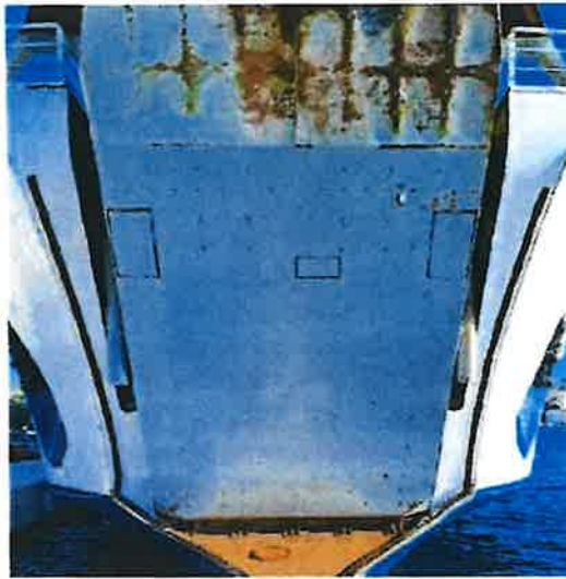
Slika 9. Prikaz položaja rampe u krajnjem gornjem položaju

Kada se rampa nalazi u krajnjem gornjem položaju potrebno je spustiti poluge (klin) za osiguranje rampe u donji položaj. Poluge (klinovi) postavljeni su obje strane pramčanog dijela broda.