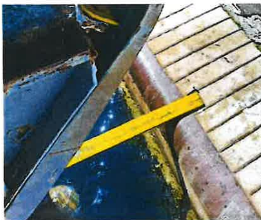
Slika 2. Daska za pristup pramčanom dijelu broda ispred rampe (utvrđeno nakon pomorske nesreće)

Dodatno, a vezano uz provjeru brtve pramčanih vrata, zapovjednik je, zapisom u brodskom dnevniku (vidi Prilog 17 ), naveo kako je on osobno zatražio provjeru brtve pramčanih vrata („vizira“) obzirom je on jedini upoznat sa istom, a što je potvrdio i u izjavi (vidi Prilog 12 ) 12 . Da je zapovjednik broda smatrao potrebnim samostalno obaviti provjeru brtve pramčanih vrata („vizira“) potvrđuje i izjava prvog časnika palube (vidi Prilog 67 ), u kojoj se navodi kako su tu provjeru planirali obaviti zapovjednik broda i vođa stroja 13 u trenutku kada je rampa podignuta.