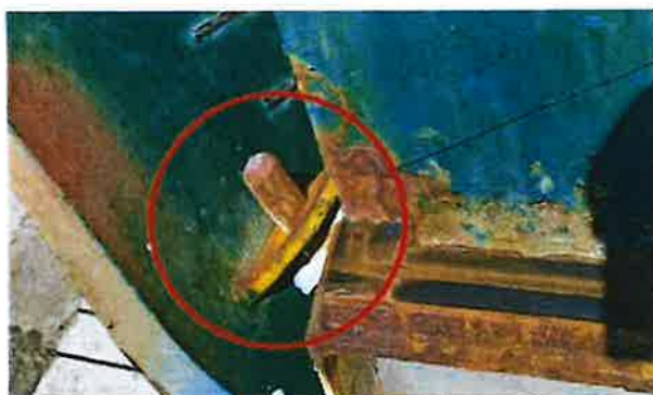
Slika 11. Prikaz bolcena uglavljenog u ušku na desnoj strani pramčane rampe

Bolcen i uška na lijevoj strani rampe - u ovom slučaju rampa je osigurana